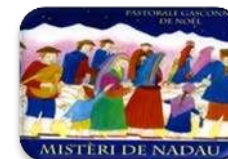
Mistèri de Nadau