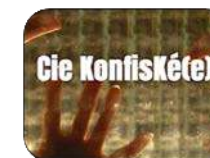
Cie Konfisk(é)e ciekonfiskee.jimdo.com