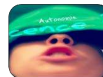
Adolescence Positive www.adolescence-positive.com