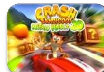
Crash Nitro Kart 3D