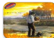
Acì qu'èm Reis, Mossu